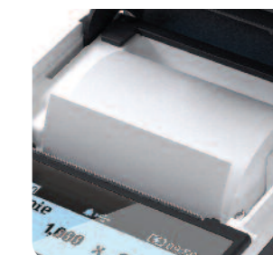
Łatwa wymiana papieru „drop in - wrzuć i drukuj”