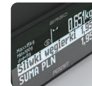
Graficzne wyświetlacze obsługi i klienta

Funkcja programowania przypomnień pozwala, aby użytkownik sam zdecydował, o czym kasa ma pamiętać. We wskazanym czasie urządzenie wydrukuje i wyświetli komunikat i przypomni o ważnej sprawie np. konieczności wykonania raportu miesięcznego, dniu płatności podatku czy urodzinach kierowniczk.