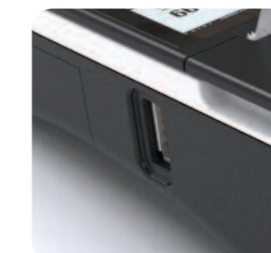
Archiwizacja danych na pendrive, obsługa skanera USB i szuflady