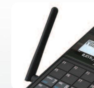
Dodatkowe interfejsy komunikacji bezprzewodowej