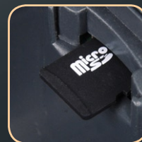
zapis kopii paragonu na karcie microSD