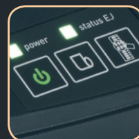
klawisz podglądu paragonu