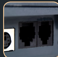
bezpośrednie podłączenie wagi, czytnika kodów kreskowych, komputera i szuflady