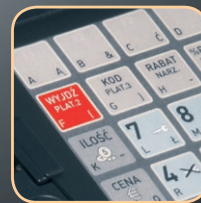
wymienna wkładka klawiatury

„Kasa ELZAB Mini E to niezawodna kasa posiadająca udogodnienia przygotowane z myślą o użytkownikach wystawiających powtarzające się w treści paragony. Zastosowano wygodny w eksploatacji i wytrzymały mechanizm drukujący. Zapis kopii paragonu na karcie microSD mieści około 1 000 000 paragonów .”